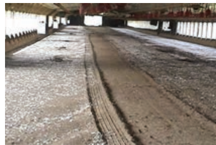
تصویر ۴-۷- تخلیه‌ی قسمتی از کود سالن پرورش به روش مکانیکی