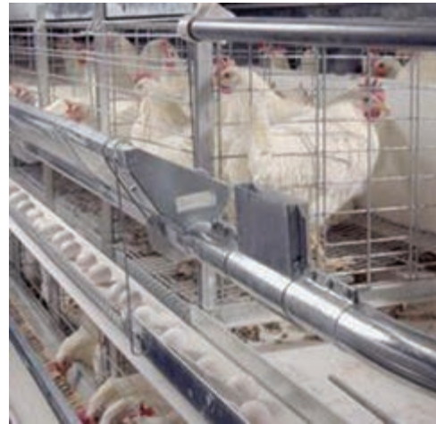
تصویر ۷-۸ - انتهای نوار نقاله در سالن