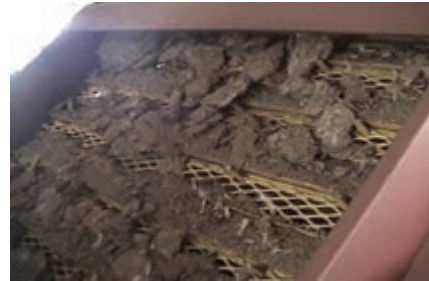
تصویر ۳-۷- کود در حال تخلیه از ماشین‌آلات مکانیکی

نوار نقاله: در قفس‌های دارای نوار نقاله، کود در زیر قفس بر روی صفحه‌ای از جنس پلاستیک ضخیم یا برزنت می‌ریزد. صفحه به صورت نوار بی‌انتهایی است که روزانه یک بار به حرکت درمی‌آید. در انتهای سالن روی هر نوار یک تیغه به صورت ثابت نصب شده است. تیغه کود را می‌تراشد و در چاله می‌ریزد.