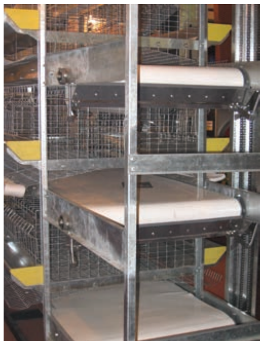
تصویر ۶-۷- انواع نوار نقاله