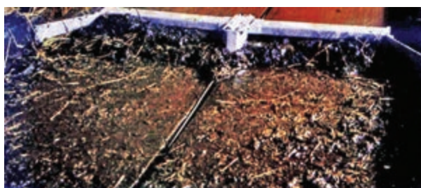
تصویر ۹-۷- تیغه‌ی جمع‌آوری کود