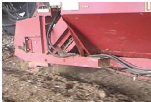
تصویر ۲-۷- جمع‌آوری کود با ماشین‌آلات مکانیکی