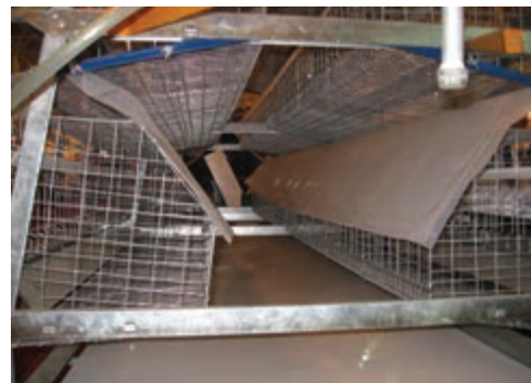
تصویر ۵-۷- صفحات مایل در زیر قفس

در سیستم قفس روش‌های متفاوتی وجود دارد اما دو روش اصلی جمع‌آوری کود به صورت دستی و خودکار است. ۱- دستی: در روش دستی از صفحات مایلی در زیر قفس استفاده می‌کنند. این صفحات سبب می‌شوند کود به راهروی بین قفس‌ها بریزد و سپس کارگران زیر قفس‌ها را با وسایل ابتدایی تخلیه می‌کنند.