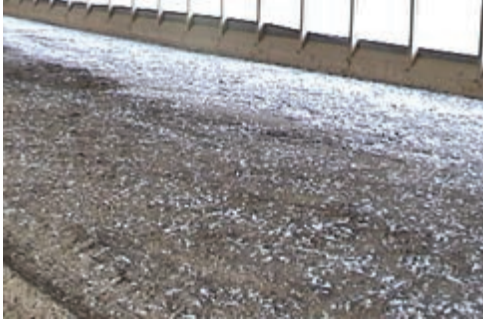
تصویر ۱-۷- کود ناخالص در پایان دوره‌ی پرورش

یکی از مسائل صنعت طیور چگونگی حذف مواد زائد از سالن‌های مرغداری است. کود به علت داشتن عوامل بیماری‌زا، افزایش رطوبت بستر، تولید بوی نامطلوب و نیز ازدیاد حشرات مشکلات زیادی در واحدها ایجاد می‌کند. با توجه به این مسائل جمع‌آوری مناسب کود، به‌ویژه در واحدهای مرغ تخم‌گذار که دوران پرورش طولانی‌تری دارند، اهمیت زیادی دارد.