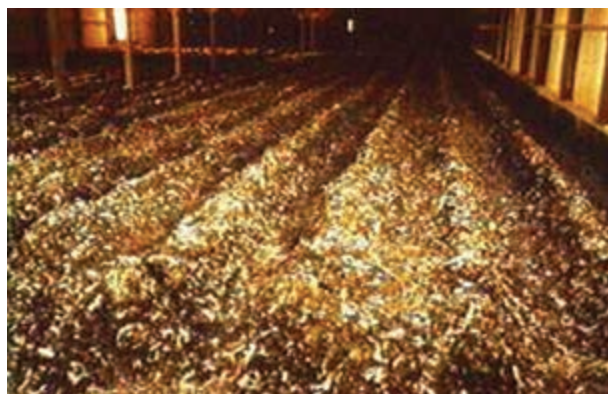
تصویر ۱۰-۷- جمع‌آوری کود در روش گودال عمیق

۳- هرگاه تیغه را بر روی ۵ متر تنظیم نمایید، تیغه از انتهای سالن حرکت می‌کند و تا ۵ متر جلو می‌آید، سپس در نقطه‌ی ۵ متر متوقف می‌شود و به عقب باز می‌گردد و تمام کودهای این فاصله را به داخل کانالی در عرض سالن می‌ریزد.